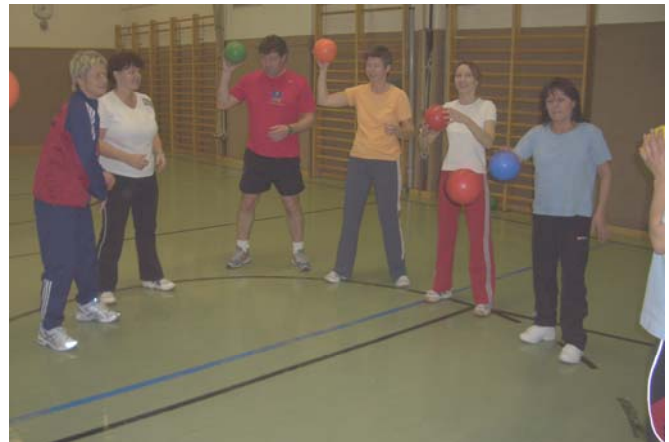
Fit mach mit!

Turnhalle fit. Mo: 19.30 Uhr bis 21.00 Uhr. Jeder ist willkommen!